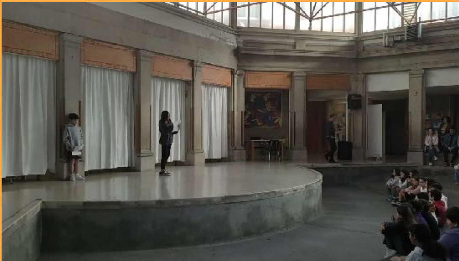
Un momento dell'accoglienza